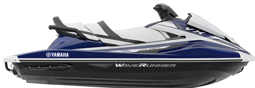
Yacht Blue Metallic