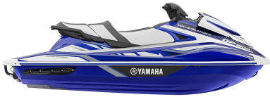
Team Yamaha Blue