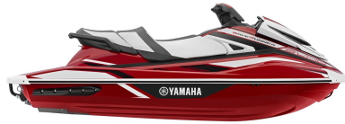
Torch Red Metallic